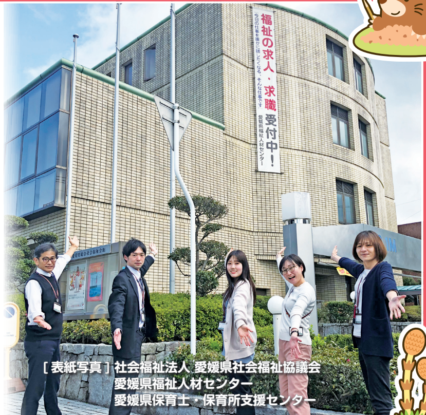
[表紙写真] 社会福祉法人 愛媛県社会福祉協議会 愛媛県福祉人材センター 愛媛県保育士・保育所支援センター