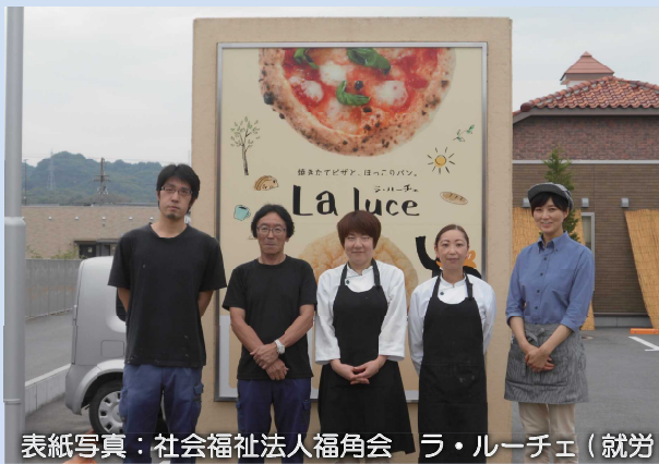
表紙写真：社会福祉法人福角会 ラ・ルーチェ（就労B・生活介護）