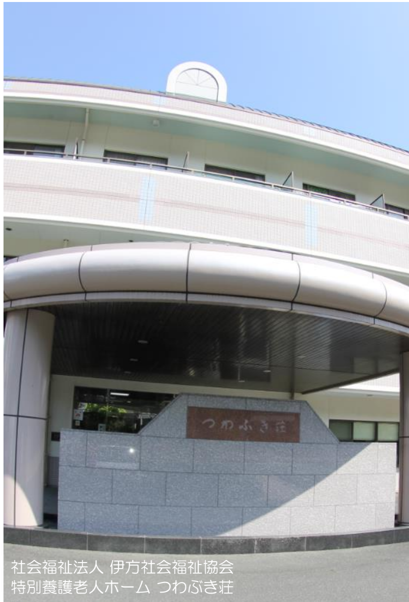
社会福祉法人 伊方社会福祉協会 特別養護老人ホーム つわぶき荘

愛媛県福祉人材センター 令和元年度 福祉のお仕事 福祉・介護求人情報誌 (No.289)